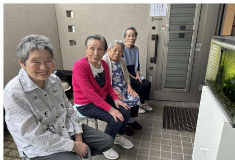
雨が止んだ際に玄関の金魚を見にいきました。場所が変わるとお話も弾みます。