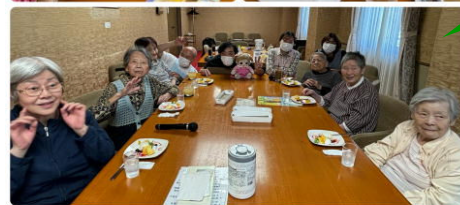
優雅なひと時を ゆっくり楽しみたい チーム