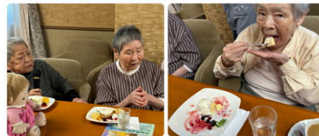
皆でワイワイ カラオケチーム