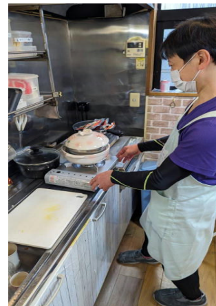
はなえくぼ扶桑 防火管理者 S. O

このような訓練を繰り返すことで、誰もが非常事態に対応できるようにし、防災意識の向上に努めてまいります。