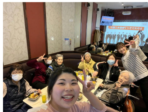
はなえくぼ扶桑 介護職員 I. A

あいにくのお天気と花冷えが続き、当初予定していたお花見ができなかったのが残念です。また、お散歩などで季節を感じたいです。