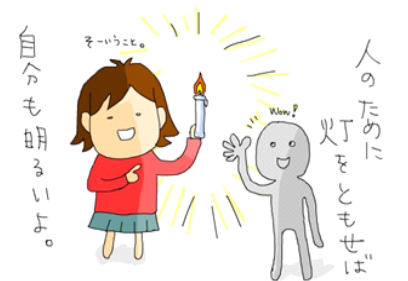
はなえくぼ扶桑 管理者 F. M

はなえくぼ扶桑では、夏祭の会場に募金箱を設置しています。赤十字に送るためです。少し前、郵便局へ行きました。その時「あっ。いつも義援金送っているはなえくぼさんですね。」と言ってくださいました。めちゃめちゃ嬉しかった。皆様にご協力頂きながら続けてきて良かった。と心から思いました。でも、「うれしい」と思ってしまった事は、自分たちを認めて欲しいだけの偽善的な感情だったのかもしれないと思うこともあります。思考の沼に入っていきます。沼をさまよって、今は偽善的な感情でもなんでも続けていこうと思っています。必要な物は必要なんです。